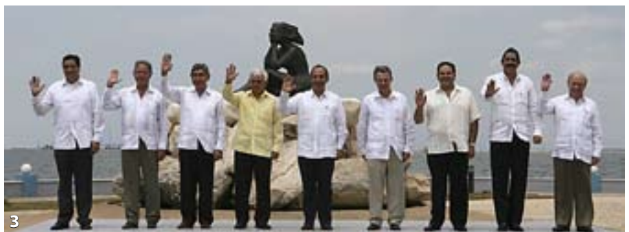
1 y 2. La ayuda alimentaria no compensa ni de lejos la pobreza que crean el resto de políticas de los países del Centro. 3. Comisión Ejecutiva del Plan Puebla Panamá. 4. Pintada contra el Plan Puebla Panamá.

El Complejo proyecta la construcción de una hidrovía de 4.200 km de largo que haría posible la navegación de grandes