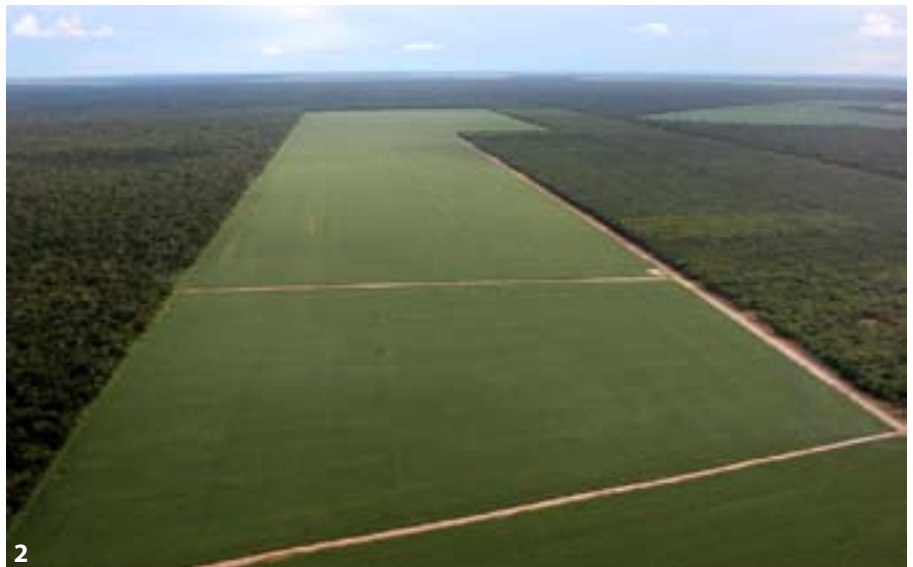
2. Cultivos de soja en la cuenca del Amazonas. FOTO: GREENPEACE. 3. Protesta contra tres de las mayores transnacionales de la agroindustria, por su responsabilidad en la destrucción de los bosques. FOTO: RAIN FOREST ACTION NETWORK

Ante lo considerado, el sentido común nos haría esperar que en las esferas de decisión se cuestione el modelo agrícola industrial en su integralidad, se tomen medidas frente a la financiarización de los productos agrícolas, se ponga fin a la concentración empresarial en la cadena productiva, y se establezca una moratoria sobre los agrocombustibles, tal y como lo recomiendan